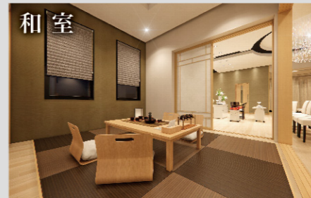
和室 ご自宅にいるかのように故人様とゆっくりお過ごしいただくことが出来ます。