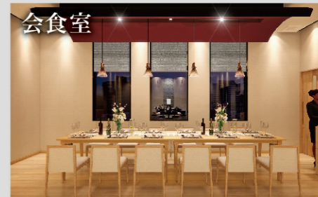
会食室 会食室も広すぎることがなく、小規模の食事にも対応しております。